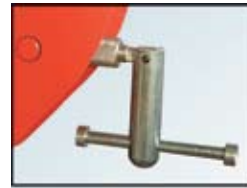
B TIP: sklopljiva ručka