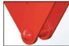
A TIP standardna