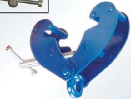
Q TIP sa ringom