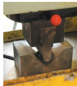
Ispitivanje čvrstoće materijala