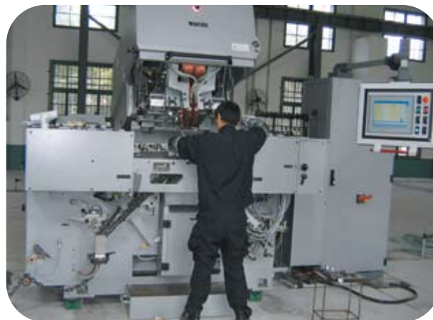
Automatski stroj za varenje lanca WAFIOS