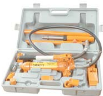
03161 PLASTIČNA KUTIJA