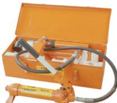
03162 METALNA KUTIJA